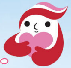
犯罪被害者等支援シンボルマーク 「ギョットちゃん」