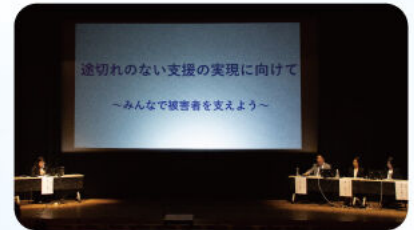
● パネルディスカッション